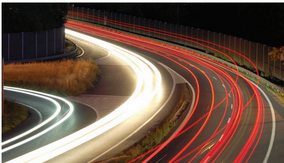
V NEDOHLEDNU. Rychlá dostavba pražského okruhu jen tak nehrozí.

V půlce května uveřejnil Nejvyšší kontrolní úřad